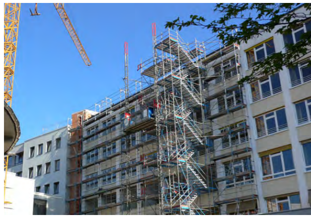
BA 7 Sanierung Ostflügel Südseite.

Im Zuge der Sanierungsmaßnahmen werden folgende ergänzende und dringend erforderliche angrenzende Maßnahmen durchgeführt: