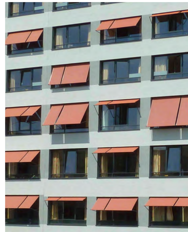
Boesel Benkert Hohberg Architekten